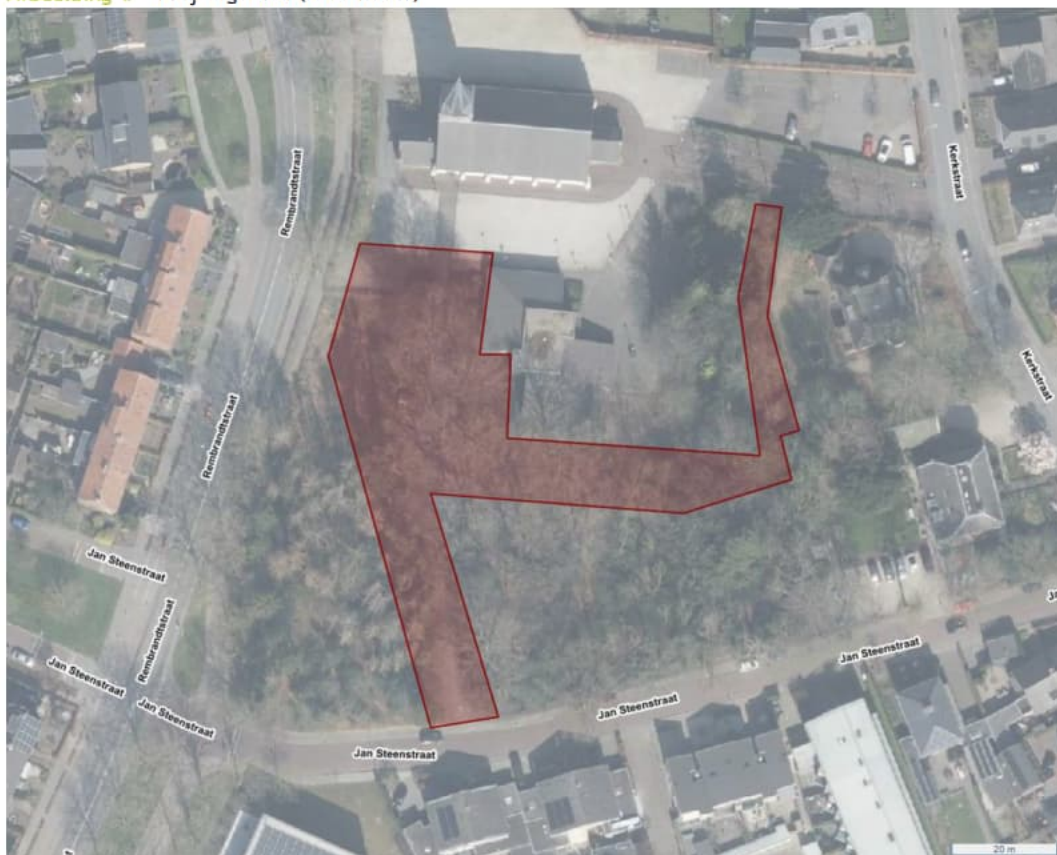
Afbeelding 1. Projectgebied (rood kader)

Het projectgebied omvat een deel van het Pastoriebos in Voorthuizen, gemeente Barneveld. Hieronder staat een kaartje van de omgeving, met het projectgebied in een rood kader.